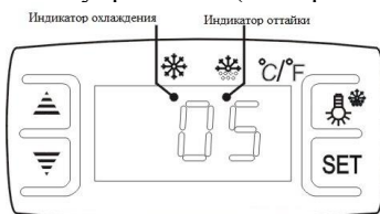
Панель управления (электронная)

Очистку оборудования проводят только с полностью отключенном электроснабжении.