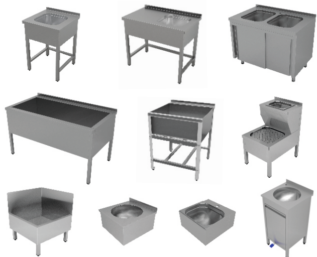
Ванны моечные, котломойки и рукомойники