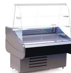
OCTAVA K (+1...+10 °C) КОНДИТЕРСКИЕ ВИТРИНЫ