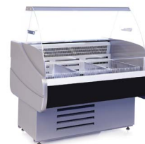
OCTAVA M (-15...-13 °C) НИЗКОТЕМПЕРАТУРНЫЕ ВИТРИНЫ