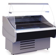
OCTAVA SN (-6...+6 °C) СРЕДНЕ-НИЗКОТЕМПЕРАТУРНЫЕ ВИТРИНЫ