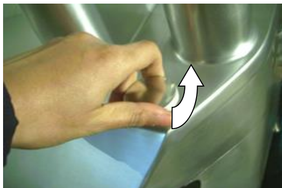
Открытие крышки (3)