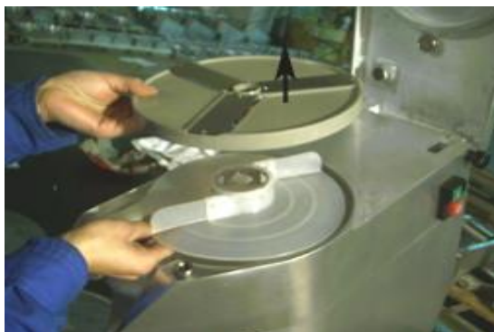
Установка режущей пластины (4)