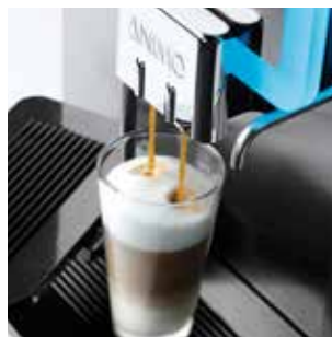
+ Большой выбор напитков на основе эспрессо, таких как латте макиато