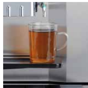
+ Отдельный краник для горячей воды