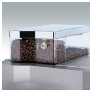
+ Свежие кофейные зерна