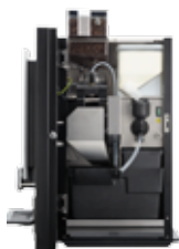
ОВ 2 (XL) NG