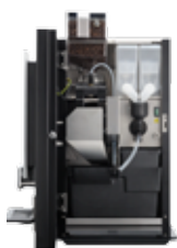
ОВ 3 (XL) NG