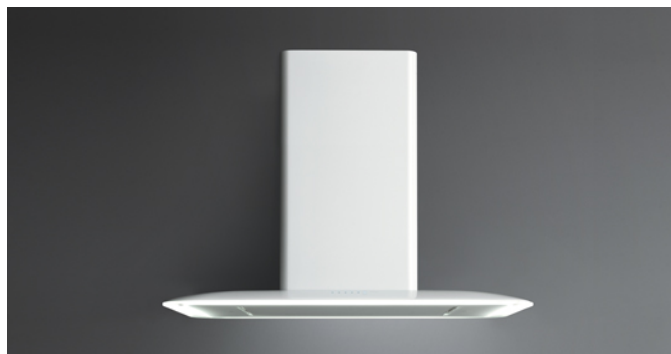
Фотография исключительно для информации Может не соответствовать выбранной версии.