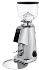
F4 E nano pag. 30