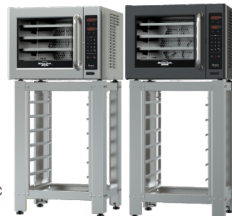
Miniconv Classic Black