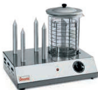
HOT DOG 4