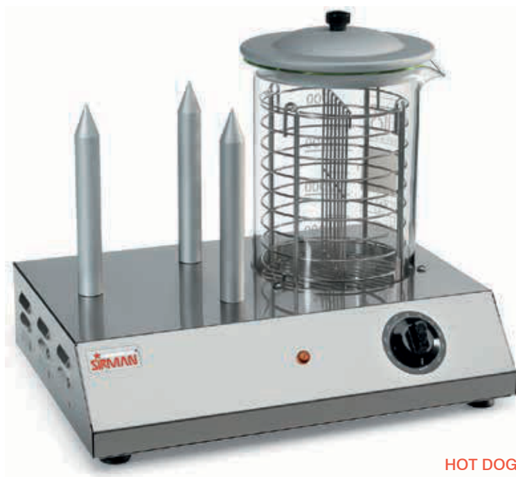
HOT DOG 3