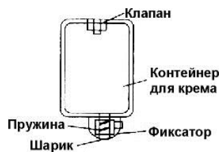
Рис.2. Контейнер для крема