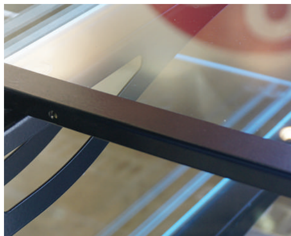
Возможность регулирования угла наклона полки