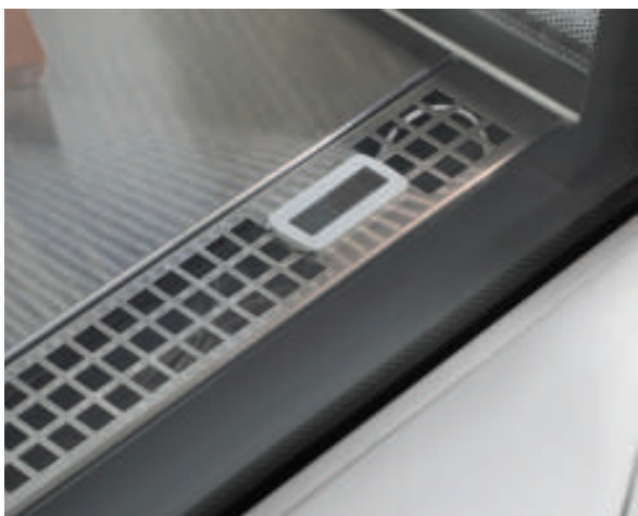
Стабильное поддержание температуры по всему объему и оптимальные условия хранения