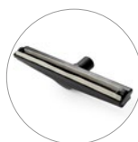
Насадка для сбора жидкости с боковыми колесами