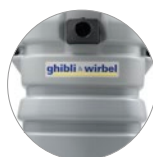
Сверхпрочный ударостойкий пластиковый бак