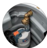
Встроенный высокопроизводительный насос