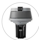
Клавиши управления и поплавковая система