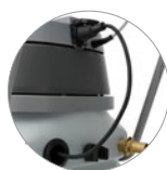
Разъем для подключения встроенного насоса