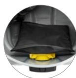
Сетчатый фильтр для крупного мусора