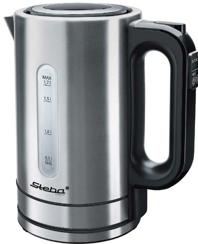
Электрический чайник WK 21 Inox