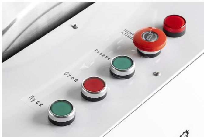
Рис.2 Панель управления