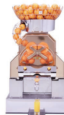
Per uso intensivo

Fantastic F/D Advance Fantastic F/SB Advance