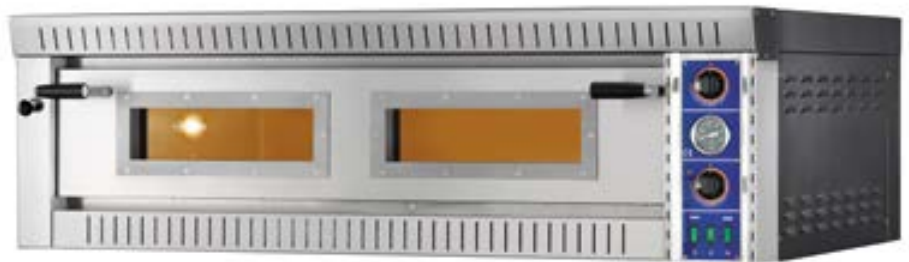
SB 6G | SB 9