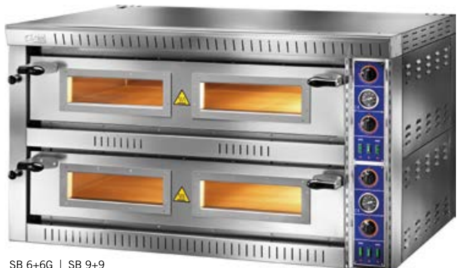
SB 6+6G | SB 9+9