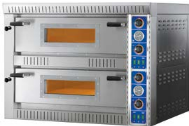
SB 4+4 | SB 6+6