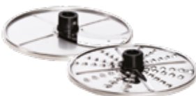
Набор из 2 режущих дисков