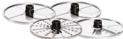
Набор из 4 режущих дисков