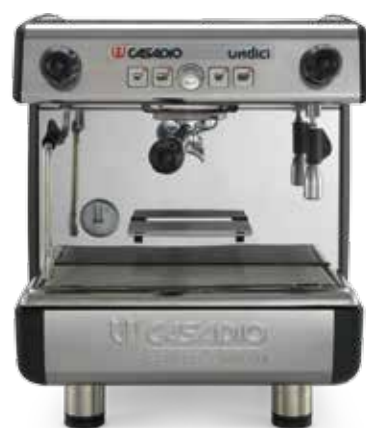
A1 Coffee To Go