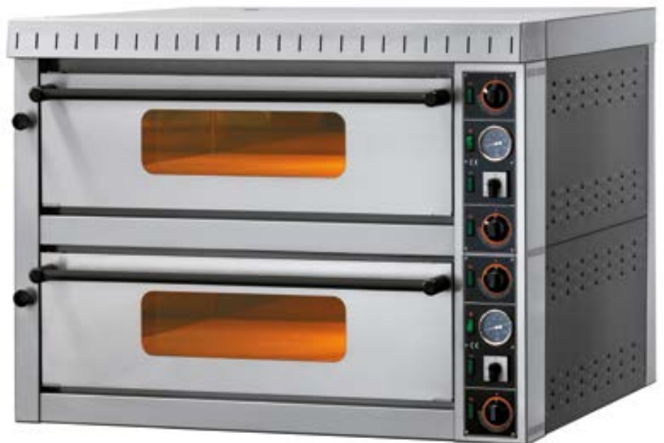
MD 4+4 | MD 6+6