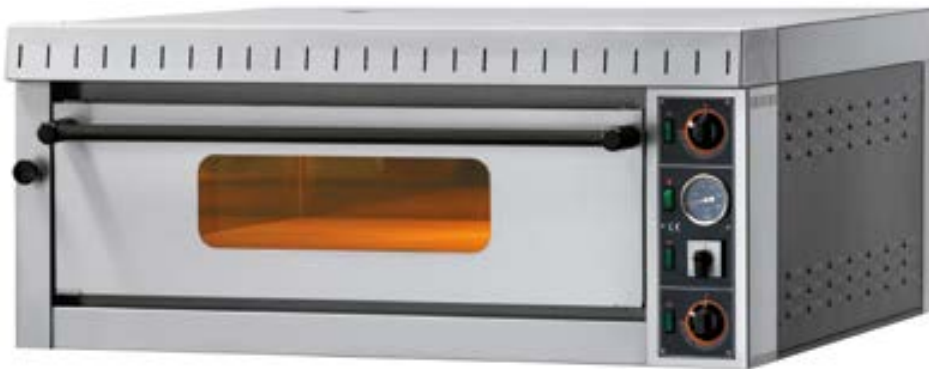
MD 4 | MD 6

electric pizza oven four électrique à pizza horno para pizzería