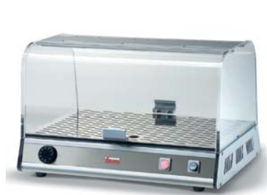
VISTA P1 BRIOCHES