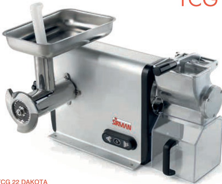
TCG 22 DAKOTA