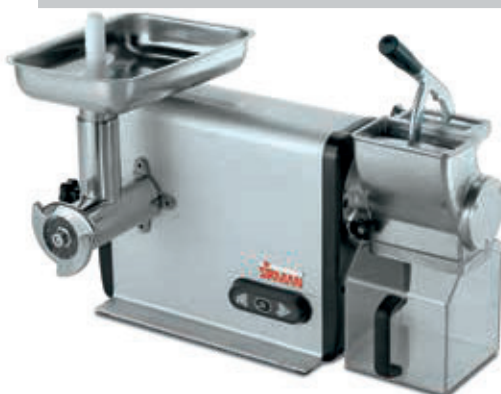
TCG 12 DAKOTA