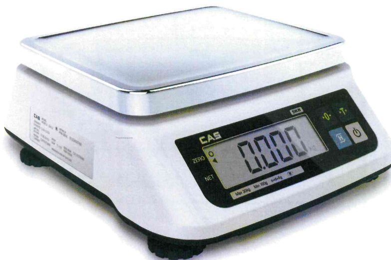
Рисунок 1 - Общий вид весов

Общий вид весов представлен на рисунке 1.