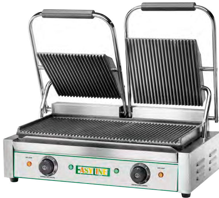
EG-03 Rigata - Lined - Rainurées - Gestreifte - Raiada - Рифлёная EG-03M Mista - Mixed - Mixte - Kombiniert - Mixta - Смешанные