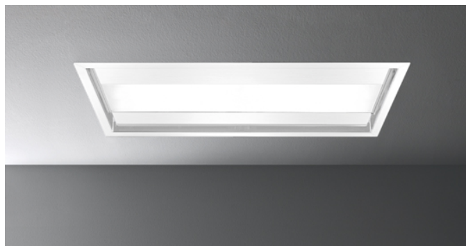
Фотография исключительно для информации Может не соответствовать выбранной версии.