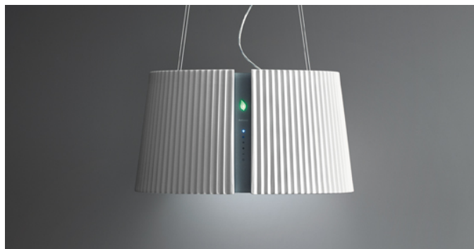
Фотография исключительно для информации Может не соответствовать выбранной версии.

Тип установки Островные Габаритные размеры 67 см Отделка Lower part in tempered glass White ceramic Мотор 450 м 3 /h Тип управления Сенсорное управление Количество скоростей 3 Освещение Led 4x1,2 W - 3200 K Фильтр Metallic filter "Top" - 235x306 mm Угольный фильтр Carbon.Zeo filters (Входит в комплектацию) Минимальное расстояние Газовая поверхность: 60 см Электр. поверхность: 52 см