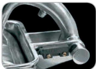
Microinterruttore su grattugia Microwitch on the grater

Optional: Push-button panel with reverse