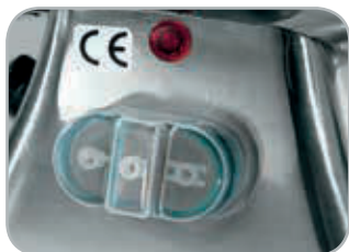
Opzionale: Pulsantiera con inversione di marcia

Optional: Push-button panel with reverse