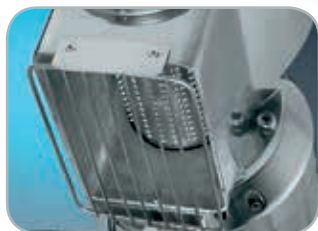
Griglia di protezione rullo inox di serie Protection grate/Standard stainless steel drum