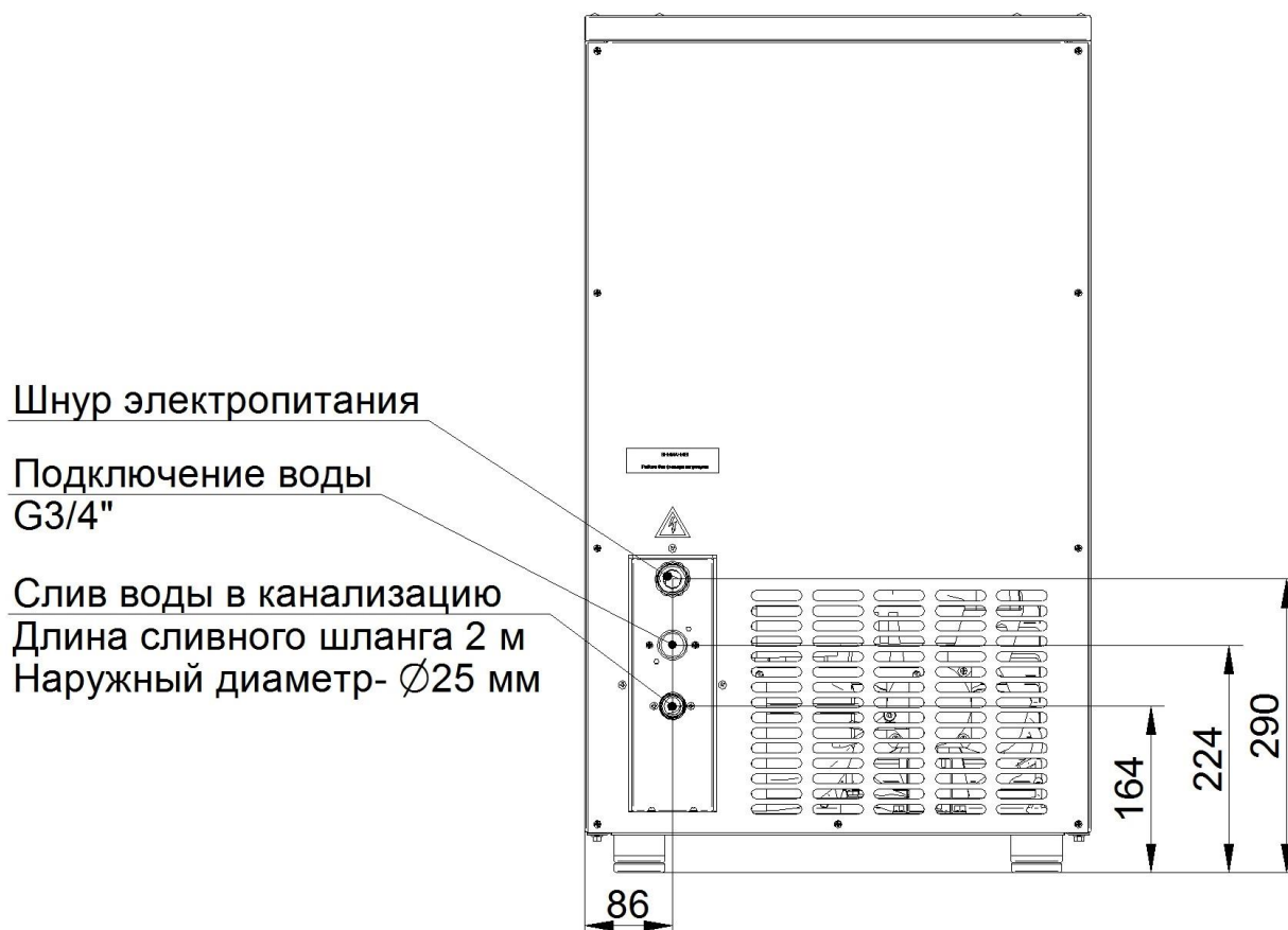
Рис. 3. Схема подключения льдогенератора