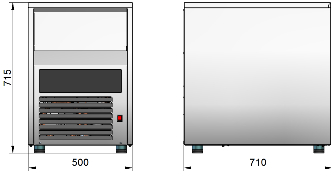
Рис. 1. Общий вид льдогенераторов ЛГ-60/20Г-01, ЛГ-60/20Г-02

1.2 Общие виды льдогенераторов приведены на Рис. 1, 2.