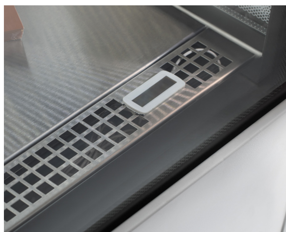
Стабильное поддержание температуры по всему объему и оптимальные условия хранения