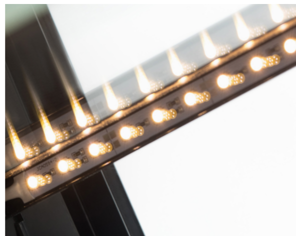
LED-подсветка экспозиции: полки и внутреннего пространства