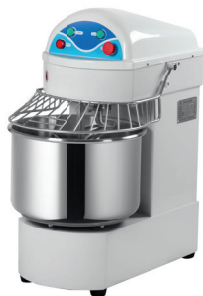
HS 20A/20B/30B/ 40B/50B