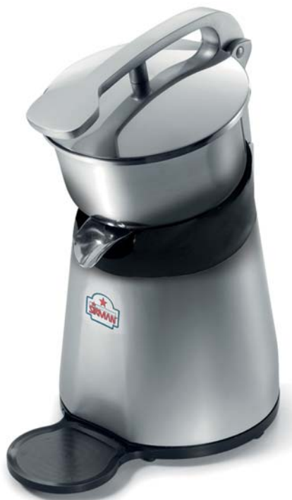
MERCURIO CON LEVA