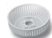
Setaccio con 2 pigne Sieve with 2 reamers