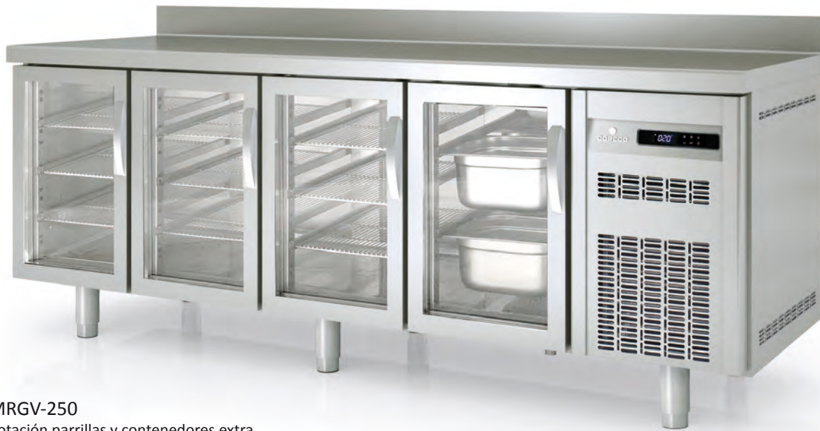
MRGV-250 dotación parrillas y contenedores extra with extra containers and shelves