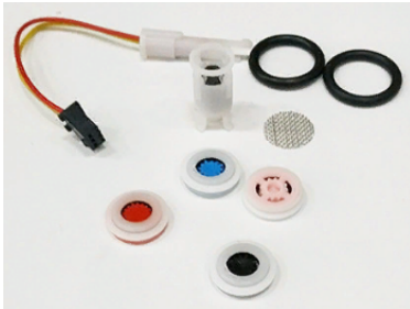
45262200 Поплавок магнитный для датчика протока