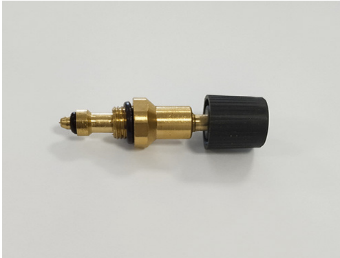
41560240-12 Переналадка на сжиженный газ d.0,82 mm