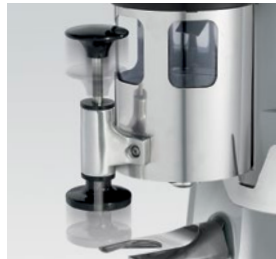
pressino telescopico / telescopic tamper