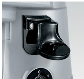
pressino laterale destro o sinistro right or left side tamper