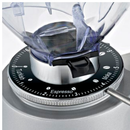
regolatore macinatura micrometrica micrometric grinding adjustment