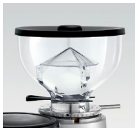
campana 250g / coffee bean hopper 250g