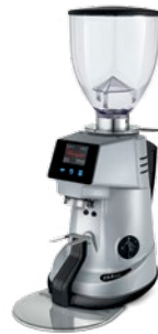
F64 EVO XGi pag. 15