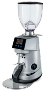
F64 E XGi pag. 14