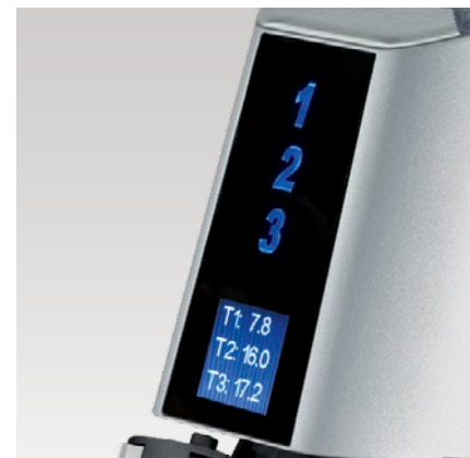
display touch touch display