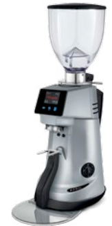
F71 KE XGi pag. 18