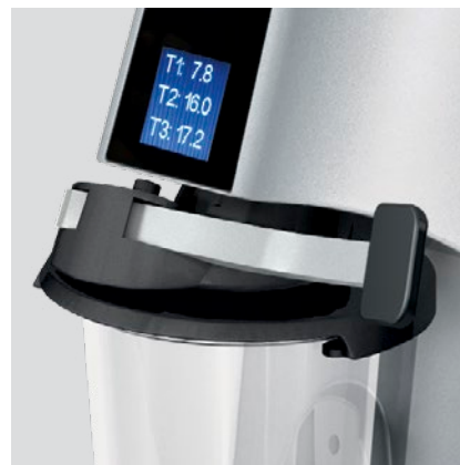
leva blocco bicchiere beaker locking lever