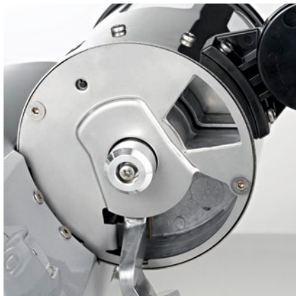
regolazione dose dose adjustment