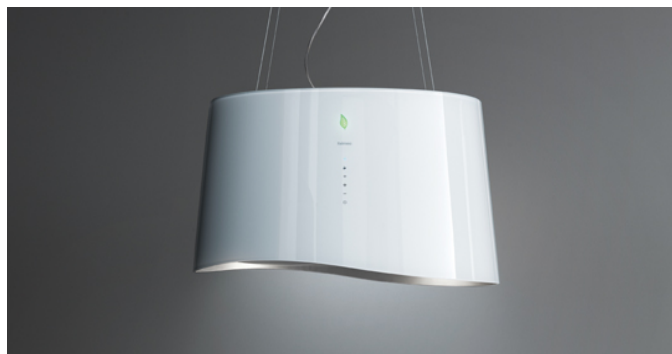
Фотография исключительно для информации Может не соответствовать выбранной версии.

Тип установки Островные Габаритные размеры 66 см Отделка White glass Мотор 450 м 3 /h Тип управления Сенсорное управление Количество скоростей 4 Освещение Led 4x1,2 W - 3200 K Фильтр Metallic filter "Base" - 274x274 мм Угольный фильтр Carbon.Zeo filters (Входит в комплектацию) Минимальное расстояние Газовая поверхность: 60 см Электр. поверхность: 52 см