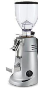
F71 KD pag. 40