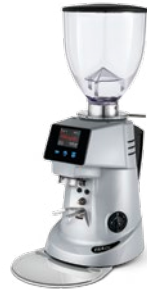
F64 EVO pag. 32