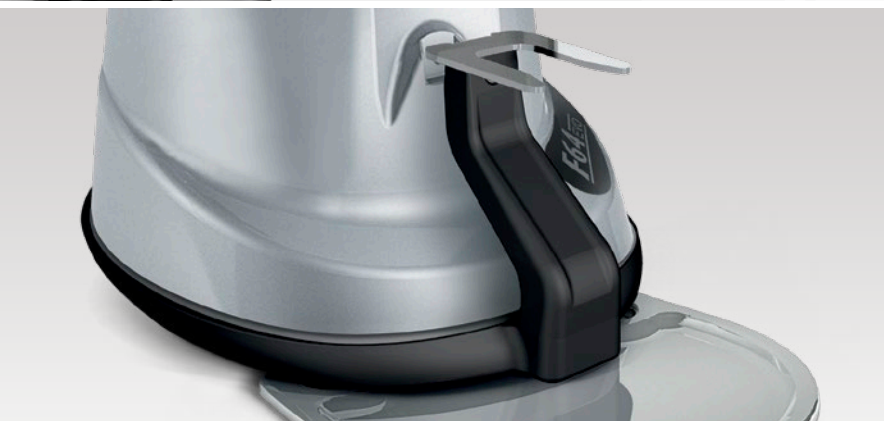
dispositivo per la taratura e la pesatura della dose di caffè device used to calibrate and weigh the dose of coffee

Thanks to the innovative patent of the XGi coffee grinder, the quantity of coffee dispensed, calculated in grams and set ONLY ONCE , will not change, guaranteeing precise doses and avoiding any waste.