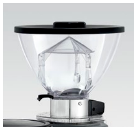
campana 500g / coffee bean hopper 500g