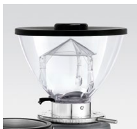
campana 500g / coffee bean hopper 500g