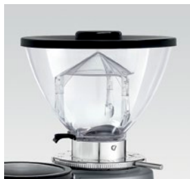
campana 500g / coffee bean hopper 500g