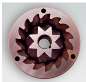
macina red speed / red speed blades