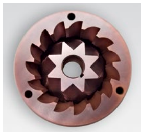
macine red speed / red speed blades