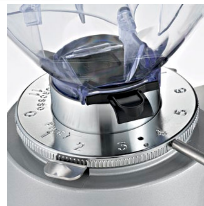
regolatore macinatura micrometrica micrometric grinding adjustment