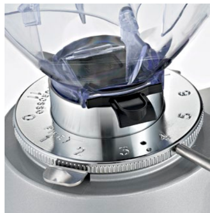
regolatore macinatura micrometrica micrometric grinding adjustment