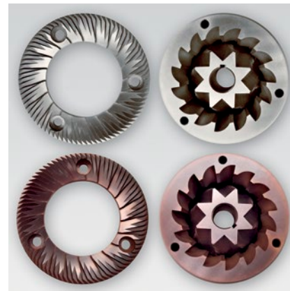
macine piane, coniche e red speed lunga durata flat, conical and red speed long duration blades