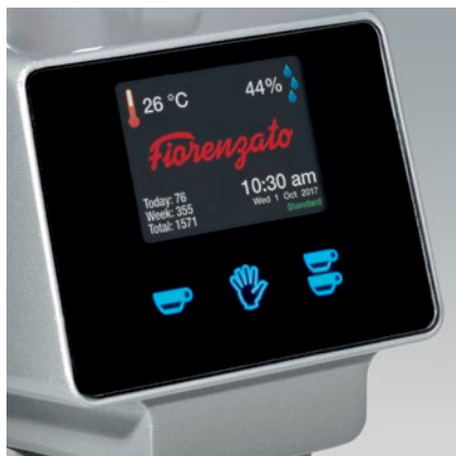
display touch touch display