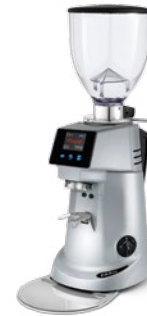
F63 KE pag. 34