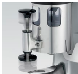
pressino telescopico / telescopic tamper