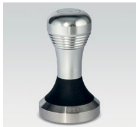
pressino in metallo / metallic tamper