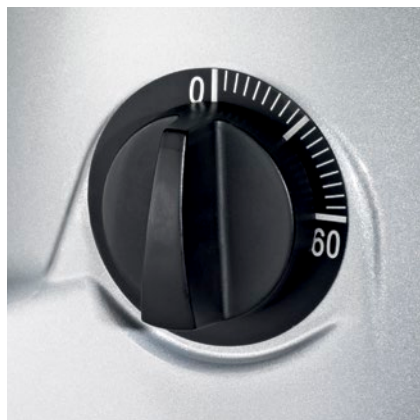
interruttore timer timer switch