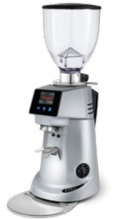
F71 KE pag. 35