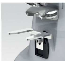
forcella regolabile / adjustable fork