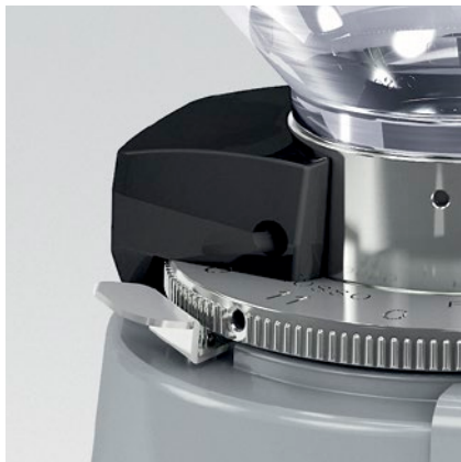
blocco ghiera - blocco campana ring nut lock - coffee bean hopper lock