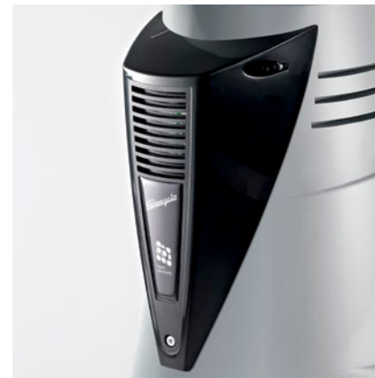
ventola di raffreddamento automatica automatic cooling fan