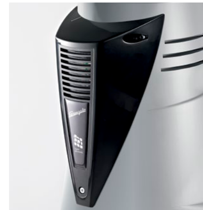
ventola di raffreddamento automatica automatic cooling fan