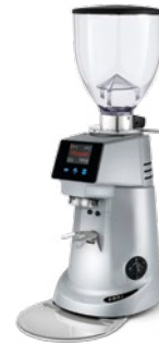
F83 E pag. 33