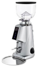
F4 E nano pag. 30