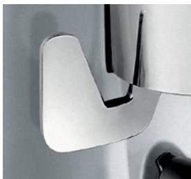
dosatore sinistro / LH dispenser