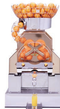
Per uso intensivo

Fantastic F/D Advance Fantastic F/SB Advance