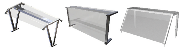
V-образные Г-образные Наклонные

*Изображены три самые популярные модификации