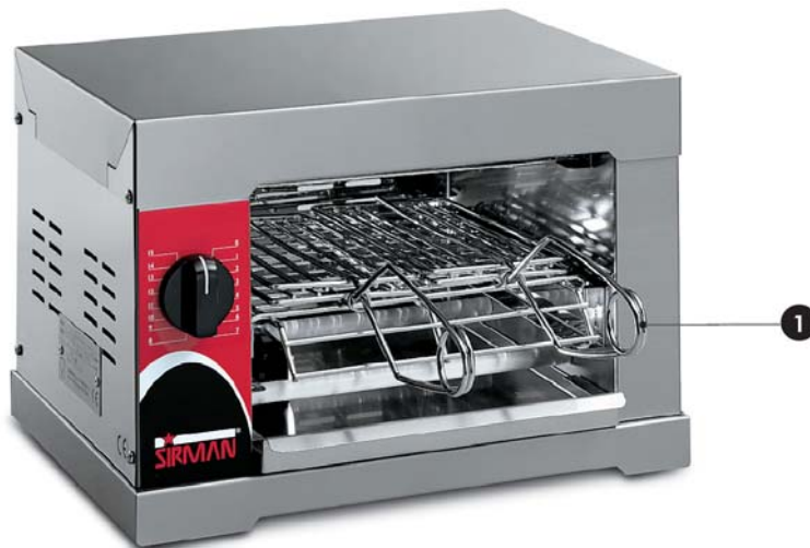
4Q 1. pinze di serie 1. Standard tongs