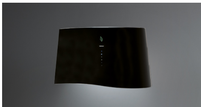
Фотография исключительно для информации Может не соответствовать выбранной версии.

Тип установки Настенные Габаритные размеры 66 см Отделка Black glass Мотор 450 м 3 /h Тип управления Сенсорное управление Количество скоростей 4 Освещение Led 4x1,2 W - 3200 K Фильтр Metallic filter "Top" - 235x306 mm Угольный фильтр Carbon.Zeo filters (Входит в комплектацию) Минимальное расстояние Газовая поверхность: 60 см Электр. поверхность: 52 см