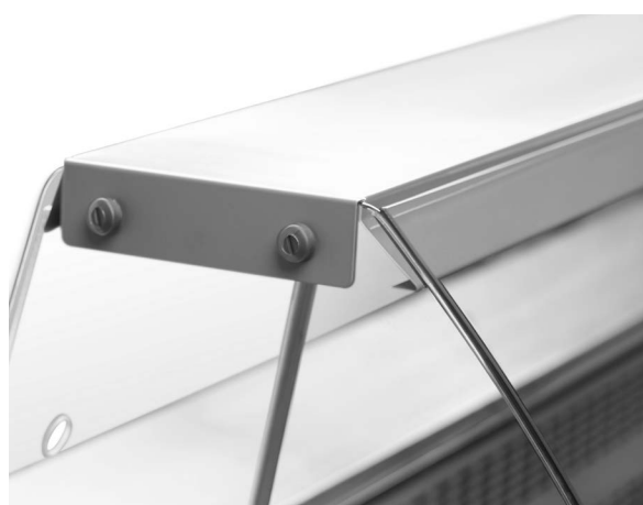
Минимальные габаритные размеры